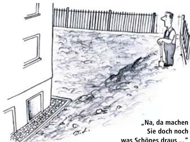
„Na, da machen Sie doch noch was Schönes draus ...“

Ich wüsste noch genug solcher Geschichten, um einen ganzen Kabarettabend davon zu bestreiten, aber es ist nicht meine Absicht, einen Missstand ins Komische zu ziehen, der dem Gärtner manches Projekt, dem betreffenden Bauherrn aber womöglich für immer die Freude an seinem Grundstück verdirbt. Ich bin mir durchaus darüber im Klaren, dass die Probleme, die sich aus Enge, Zeitdruck und Geldmangel ergeben, auch einem Architekten das Leben sauer machen, sodass es ihm oft schwer fallen muss, den Blick über seine baulichen Aufgaben hinauszurichten. Mitun-